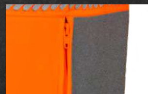
Deux poches basses fermées par glissière.